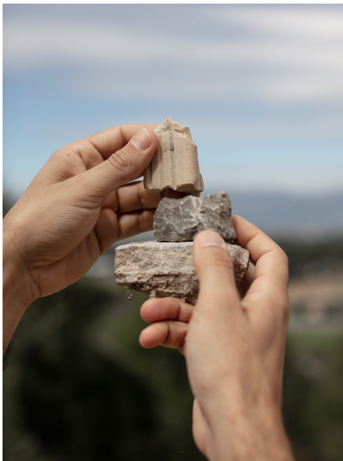
Naissance d'une montagne (Dylan Perrenoud, 2020).