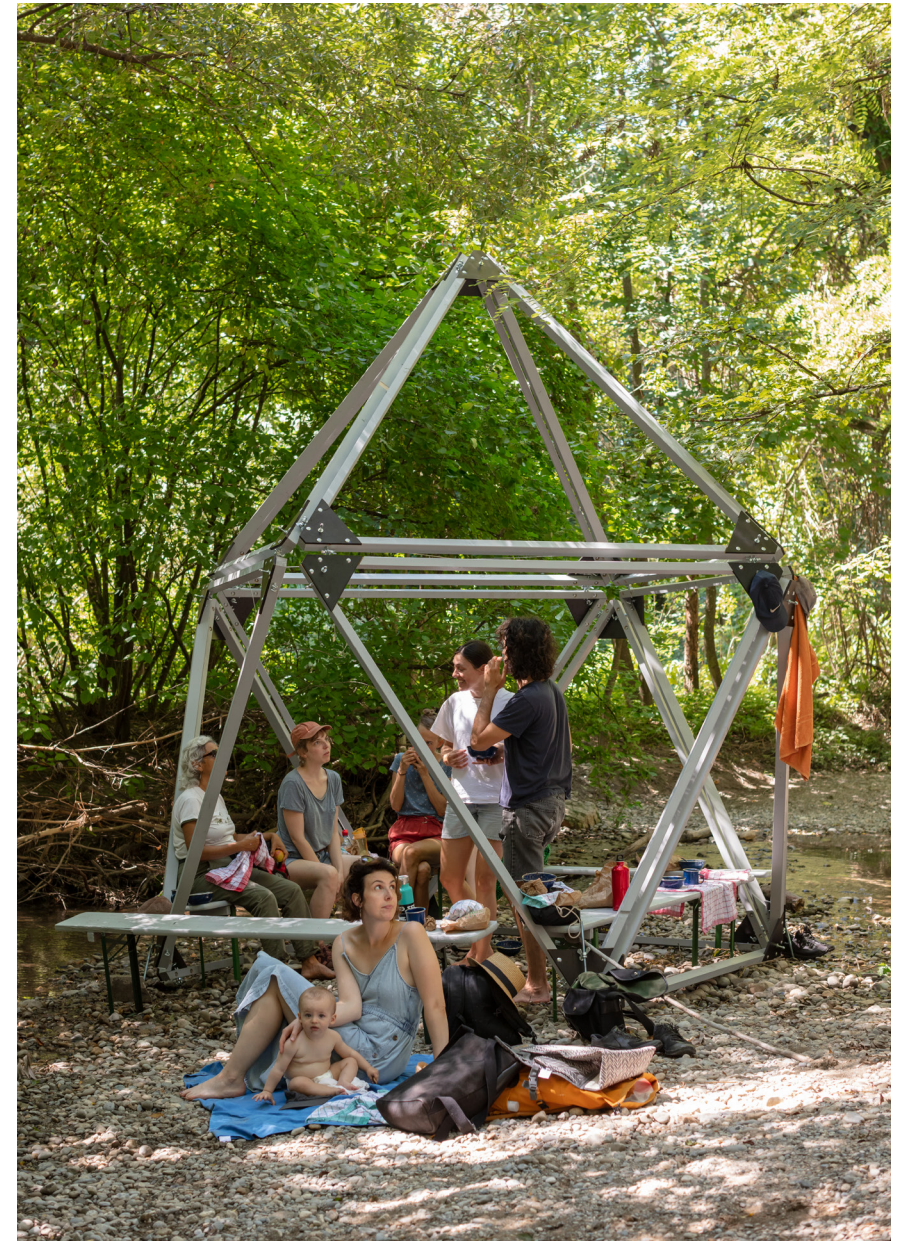
Sous le PAV, les ruisseaux (Dylan Perrenoud, 2020).

Pour explorer des terrains dans lesquels l'on s'immerge, un dispositif logistique minimal est nécessaire. Mobile, léger, transportable, il tient autant du module spatial que du campement de l'archéologue. Il est à la fois un lieu de vie et un laboratoire portable, ouvert sur les espaces qu'il permet d'aborder. Il rend visible une présence (bannière, drapeau, totem) et garde trace des données collectées précédemment à d'autres endroits (fonction d'archive, de témoignage). Le dispositif permet, par sa modularité, de cadrer un aspect particulier, un paysage, un détail ou un élément du site investigué. Sans être fermé, il assume aussi d'être un abri, un campement, un lieu de vie. Il souligne l'habitabilité, même minimale, des espaces dans lesquels il s'insère temporairement. Il se veut un générateur d'interactions, d'aléas et de rencontres. Bien qu'extrêmement simple en termes de structure, l'apparence du module évolue constamment : chacune des sessions exploratoires laisse des traces sur la surface du dispositif.