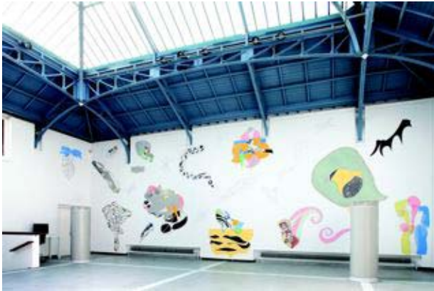
Bruxelles, La Verrière, 2009