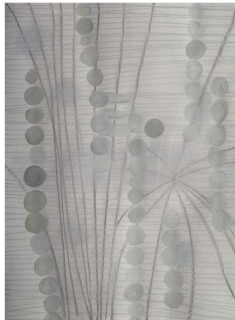
Silvana Solivella, 2011 Série de dessins «Encantada» technique mixte (fusain, crayon graphite, pastels)