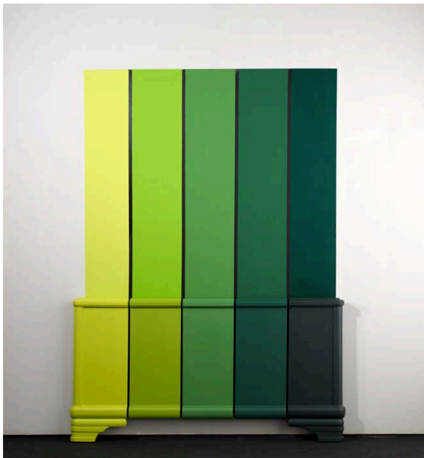
Deva Sand, Pantone