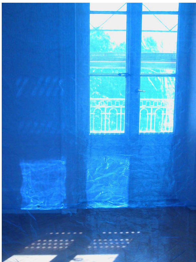
Carola Bürgi, Outside-In , installation à la Villa Bernasconi, filet pour échafaudage, agrafes, câbles et tendeurs, 320 cm x 110 cm x 250 cm