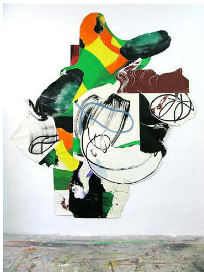
Juan Olivares, Déjeuner sur l'herbe , 2011

Cette procédure de travail me permet d'adapter la pièce à l'espace, sur le mur de la cage d'escalier.